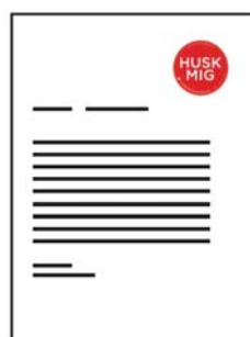
Brev og indsamlingstilladelse